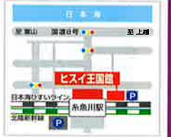
●系魚川駅前 系魚川.Cから車で5分

10:00~ あんこう汁販売 [1000杯限定/500円] 10:30~(1回目)11:30~(2回目) あんこうつるし切り実演 13:00~ ヒスイなど系魚川の産物が当たる お楽しみ抽選会 系魚川小学校6年生の 学習発表があります お問い合わせ 系魚川市観光案内所 TEL.025-553-1785